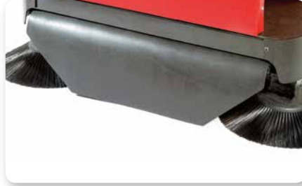
Convogliatore polvere Dust conveyer Encaminador de polvo