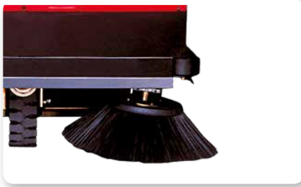
Braccio spazzola laterale sinistro Left side brush arm Brazo lateral izquierda