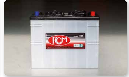
6 batterie 6V-320 Ah (5h) - (E) no.6 batteries 6V-320 Ah (5h) - (E) 6 batterie 6V-320 Ah (5h) - (E)