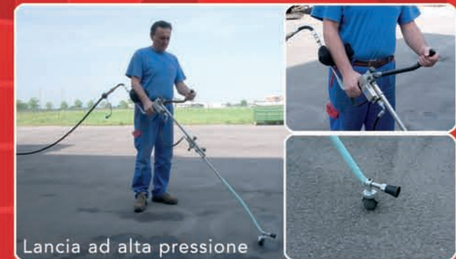
Lancia ad alta pressione